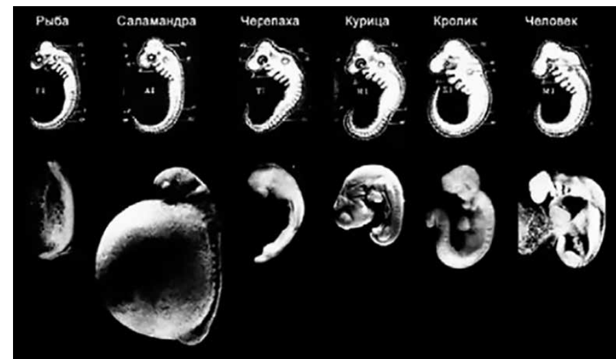
Верхний ряд. Э. Геккель: изображения эмбрионов разных животных, обнаруживающих невероятное сходство в одной из ранних стадий развития.

— В 1999 году на обложке ноябрьского номера журнала National Geographic появилась фотография останков «археораптора», сочетающего в себе признаки птицы и динозавра. «Археораптор» был назван «эволюционистской находкой столетия», поскольку эта находка якобы доказывала эволюционное происхождение птиц от динозавров. Однако более тщательное исследование показало, что «археораптор» представляет собой просто искусно созданную компиляцию из двух разных су-